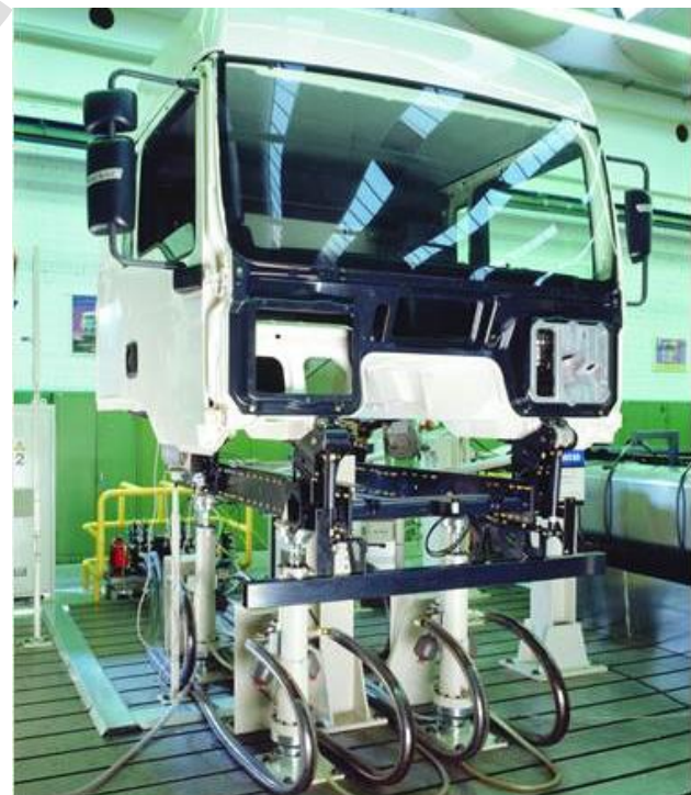
Bild 9: Servozylinder für hochdynamische Simulation von Bewegungen in separatem Prüfraum

Für den Fall, dass die zu prüfenden Bauteile mit Hilfe kraftbetätigter Spanneinrichtungen fixiert werden, ist auch für diese Spannfunktion eine Risikobeurteilung durchzuführen. Hierbei können verschiedene Maßnahmen zur