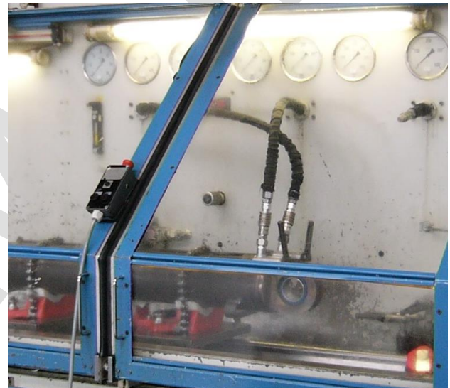
Bild 5: Hydraulischer Zylinderprüfstand mit geschlossener trennender Schutzeinrichtung

Ferner zählen auch Prüfstände für die Reparatur und Einstellung von Pumpen, Hydromotoren und Zylindern aufgrund des Auftretens von Druck und mechanischer Bewegung der Welle oder Kolbenstange zu den kombinierten Prüfständen.