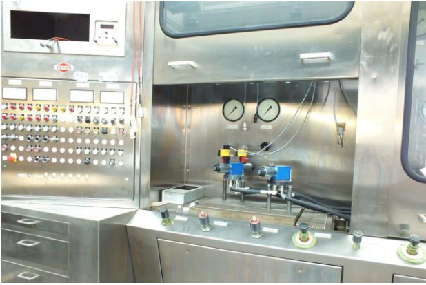
Bild 3: Hydraulischer Komponentenprüfstand mit geöffneter trennender Schutzeinrichtung

Bei allen vorgenannten Prüfständen ist der Druck im System die Ursache für die Gefährdungen durch wegfliegende Teile oder austretende Druckflüssigkeitsstrahlen. Bei der Ermittlung des Berstdrucks handelt es sich in jedem Fall um eine zerstörende Prüfung.