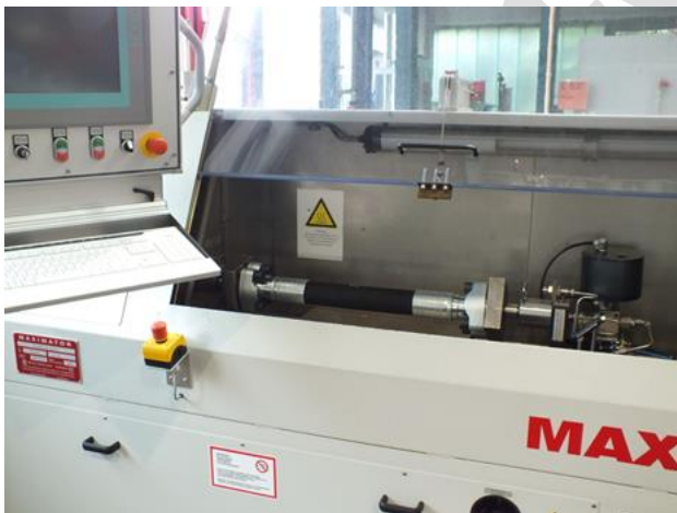
Bild 1: Berstdruckprüfstand mit geöffneter trennender Schutzeinrichtung

Bei diesen hydraulischen Prüfständen handelt es sich um Prüfmaschinen, die den Anforderungen der Europäischen Maschinen-Richtlinie [1] unterliegen. Da diese Prüfmaschinen meist kundenspezifisch für genau definierte Anwendungen gebaut werden, existieren für diese Maschinen kaum C-Normen. Diese DGUV-Information gibt einen Überblick über wichtige Sicherheitsaspekte für den Bau und Betrieb dieser hydraulischen Prüfmaschinen und unterstützt sowohl Hersteller des Prüfstands bei der Umsetzung der allgemeinen Anforderungen der Maschinenrichtlinie (MRL) als auch Betreiber.