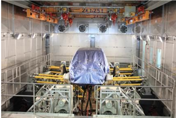
Bild 8: Servohydraulischer Fahrwerksprüfstand in separatem Prüfraum

Insbesondere an den Zugängen zu dem gefährdeten Bereich und außen auf den verriegelten Zugangstüren sind zusätzlich Schilder (Verbotszeichen P006: „Zutritt für Unbefugte verboten“) anzubringen.