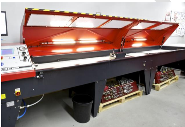
Bild 2: Druck- und Dichtigkeitsprüfstand für Hydraulik-Schlauchleitungen mit geöffneter trennender Schutzeinrichtung

Die Europäische Druckgeräte-Richtlinie fordert im Anhang I Abschnitt 3.2.2 für die Abnahme von Druckgeräten, dass dazu normalerweise hydrostatische Druckversuche durchzuführen sind und weist darauf hin, dass bestimmte Bedingungen zu erfüllen sind, bevor andere Prüfungen als die hydrostatischen Druckversuche durchgeführt werden dürfen.