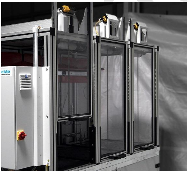
Bild 6: Geöffnete trennende Schutzeinrichtungen an einem Hydraulik-Prüfstand

Die Absicherung des Zugangs zum Gefahrenbereich erfolgt über bewegliche trennende Schutzeinrichtungen (Arbeitsraumschutztüren), siehe Bild 6. Mit dieser Schutzmaßnahme können die Anforderungen der MRL, u. a. Anhang I Nr. 1.3.2 hinsichtlich des „Bruchrisikos“ umgesetzt werden.