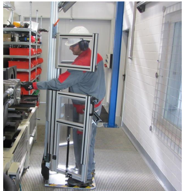
Bild 7: Manuell einstellbare Schutzeinrichtung für größtmöglichen Schutz bei Einstellarbeiten an Pumpenprüfstand in separatem Prüfraum

Für Einstellarbeiten an Prüflingen kann es erforderlich sein, dass die Bedienperson mit Werkzeugen (z. B. Schrauben-