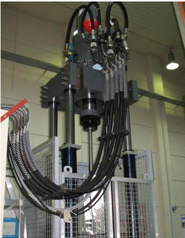
Bild 4: Hydraulischer Prüfstand für Zugversuche mit geschlossener trennender Schutzeinrichtung

Bei den Bewegungsprüfständen geht die wesentliche Gefährdung von einer hydraulisch erzeugten Bewegung aus. Dazu zählen Prüfstände mit hydraulisch angetriebenen Achsen zur Prüfung von Bauteilen und Baugruppen, wie z. B. Prüfstände für statische Versuche (Zugversuche, siehe Bild 4) oder für dynamische Versuche (Stoßdämpferfest oder Crashversuche).